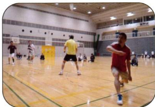
第127回大会(4/6ダブルス個人戦)より

このプレーヤーは、コート左後方へ送られたシャトルを大きく足を踏み込み、インパクトの寸前です。シニアの選手ですが、大変素晴らしいショットを行いました。